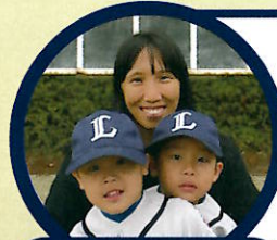
幼児クラス (3・4・5歳)

当初は次男が3歳ということもあり1時間の練習に耐えられるのかという不安が大きかったのですが、毎回異なる練習メニューでメリハリのあるご指導の元、楽しみながら練習を進めることができ日々の成長を感じています。また、挨拶をすることルール・マナーを守るという、日常生活でも大切なことを野球を通して教えていただいています。