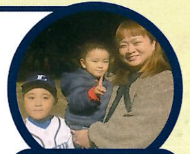
小学生クラス (6・7・8歳)

始めたきっかけはライオンズの無料体験。学校からもらったチラシを見て、本人が行ってみたいと言いつい出、申し込んでみました。すると、その体験がとても楽しかったようで、そのまま始めることに決めました。チームメイトのお兄さんたちも、立つ場所や、やり方を教えてくれました。そんな温かいチームで、楽しく練習をしています。